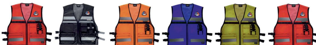
Jefe de tramo