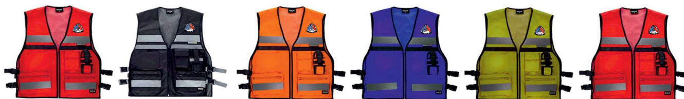
Jefe de tramo